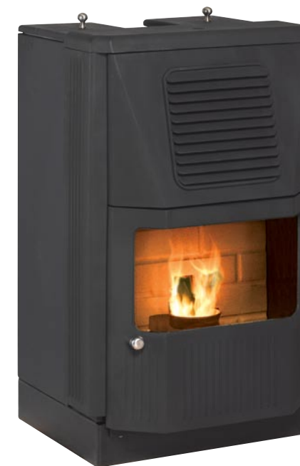
KMP MYSINGE Standardutförande