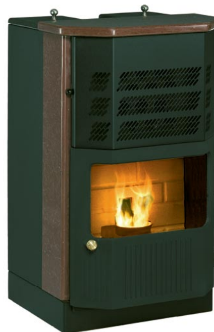
KMP SOLBERGA Extrautrustad med lucka i gjutjärn och topp och sida i röd ölandssten.