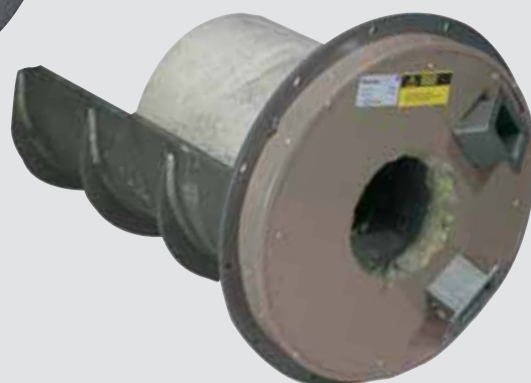
Arimax HakeJet bakifrån

Arimax HakeJet har separata fläktar för primär- och sekundärluft.