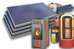
Bra prestanda i flexibla värmesystem